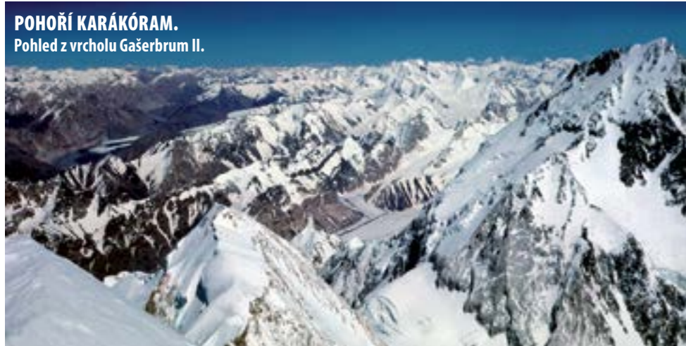
POHOŘÍ KARÁKÓRAM. Pohled z vrcholu Gašerbrum II.

text: Blanka Kubíková