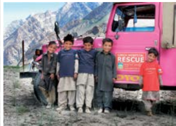
ŘÍKAJÍ JÍ MATKA ÚDOLÍ. „Pokud můžu zachránit patnáct dětí ročně, aby nezemřely bez antibiotik, nemůžu to neudělat.“