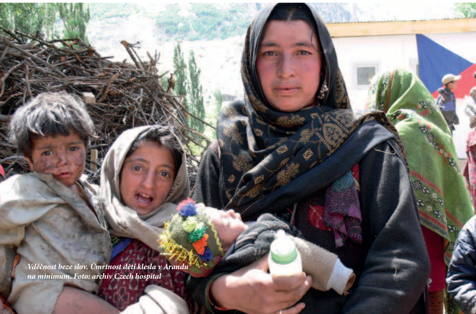
Vděčnost beze slov. Úmrtnost dětí klesla v Arandu na minimum.

Možná to některé dělají, to já nevím. Můžu ale potvrdit, že v Pákistánu a asi i jinde existují lidé, kteří z humanitárních aktivit bohatnou. Ti hledají takřikajíc dojnou