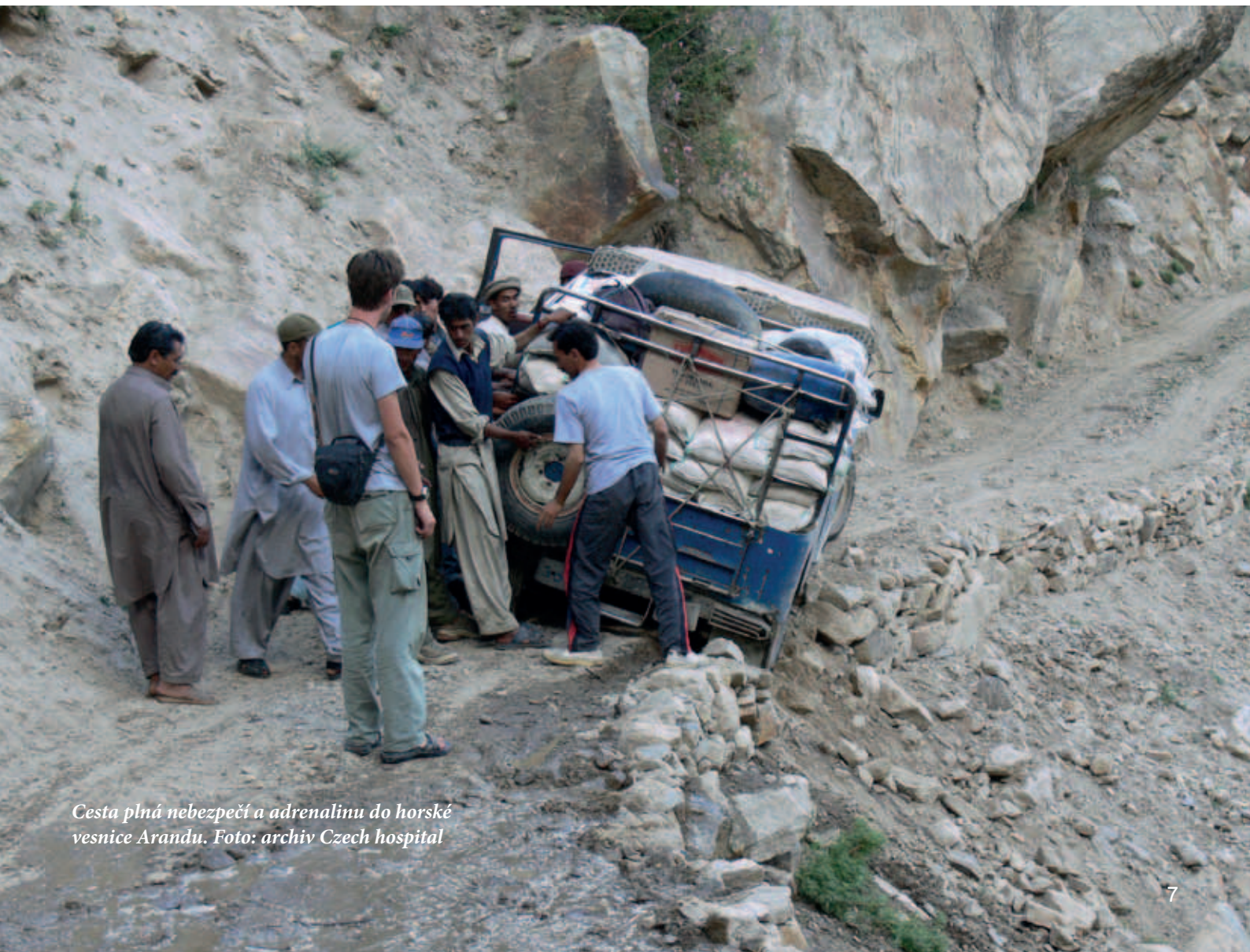
Cesta plná nebezpečí a adrenalinu do horské vesnice Arandu.

Přesně tak. Věděli jsme, že pokud má být naše pomoc skutečně efektivní a dlouhodobě udržitelná, musí se stát ještě něco víc. A od toho je tu model třech základních linií, jak by se to mělo dělat. V první jde o zajištění zdraví, což naplňuje nemocnice. Druhou je zajištění vzdělání, proto jsme opravili a rozšířili místní školu a teď stavíme malý internát ve Skardu pro děti z vysoko položených vesnic. Letos na jaře bude dodělaný. Je to nezbytné, protože by kvůli veliké vzdálenosti nemohly děti na střední školy ve Skardu chodit.